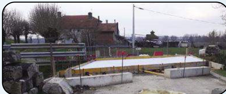
le pont au 20 février