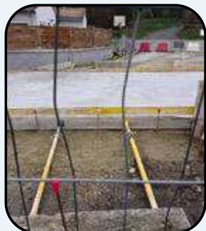
Tablier du pont en janvier

Les travaux, pilotés par la Communauté de Communes CCPAPS sont pratiquement terminés.