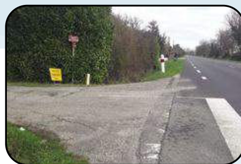
Croisement route de la plaine/RD813

Il s'agit aussi de sécuriser les croisements, c'est-à-dire celui de la RD813 en l'élargissant (busage du fossé) et celui de la RD277 en le resserrant.